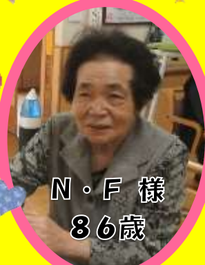
N・F 様 86歳