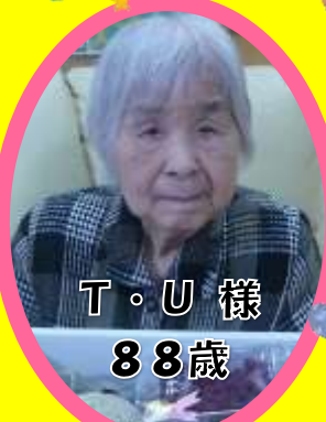
T・U 様 88歳